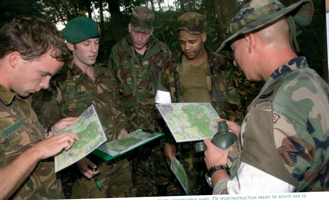
DIRECT NA DE INDIVIDUELE SPEEDMARS VOLGT EEN GEFORCEEDE MARS. DE SPORTINSTRUCTEUR NEEMT DE ROUTE VAN DE GEFORCEEDE MARS DOOR MET DE DEELNEMERS DIE INTUSSEN WATER DRINKEN EN EEN BANAAN NAAR BINNEN WERKEN.