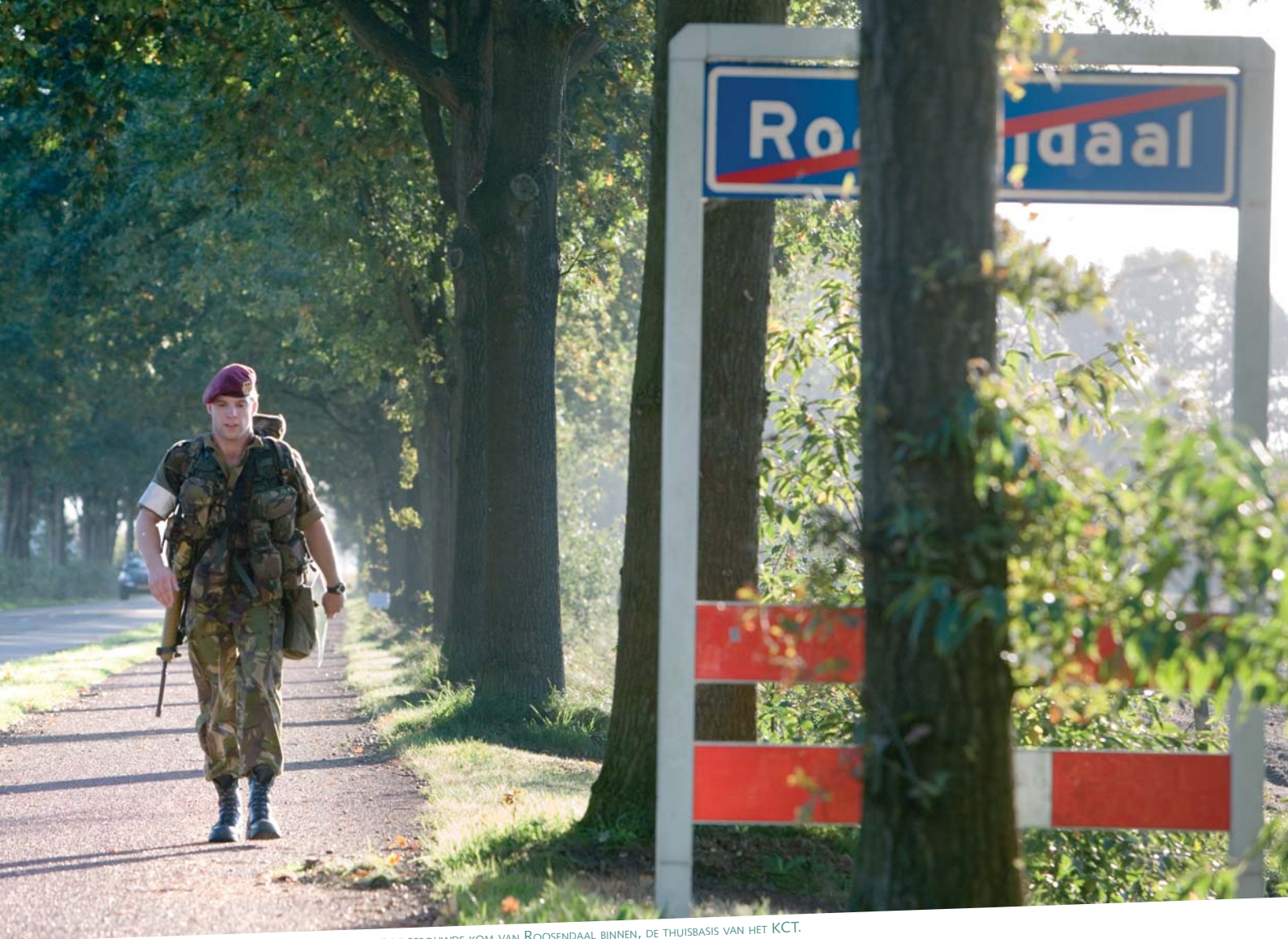
DE EERSTE DEELNEMER VAN DE GEFORCEERDE MARS LOOPT DE BEBOUWDE KOM VAN ROOSENDAAL BINNEN, DE THUISBASIS VAN HET KCT.

uitwerken terwijl de rest lekker de slaapzak in mag. Een rang draagt ook bepaalde verantwoordelijkheden met zich mee' aldus de sportinstructeur. 'Maar het wordt voor (onder)officieren niet expres zwaarder gemaakt.'