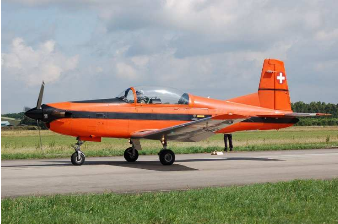
Sander de Vries