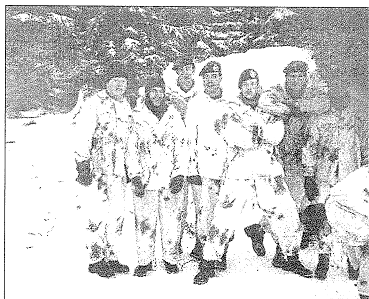
Als pelotonsgenoten van vroeger elkaar zoeken, vindt Van Heijningen z