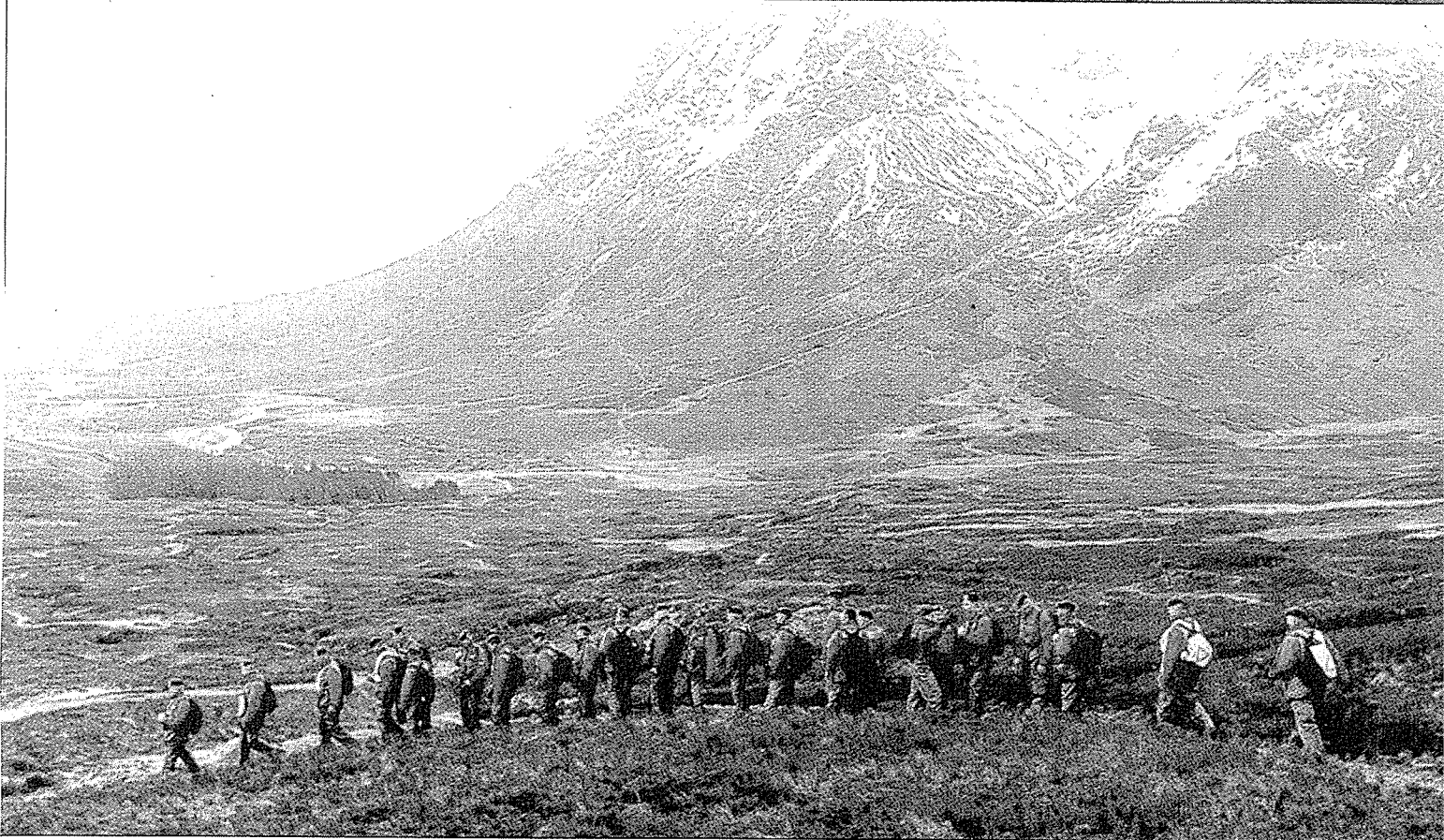
Oud-commando's onderweg van Schotland naar Roosendaal.