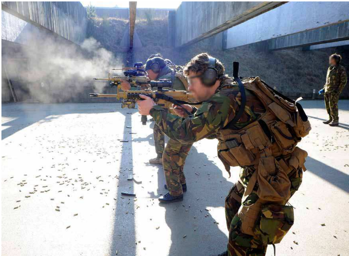
Schiettrainingen lopen als een rode draad door de opleiding voor contraterreurspecialist.

De CT-opleiding was ditmaal bedoeld voor leden van 104 en in mindere mate voor 105 Commandotroepencompagnie. Als altijd begon het programma rustig, dat wil zeggen met theorielessen. Daarna kwam er met schiet-, aanhouding- en controleoefeningen meer druk op de ketel te staan. Ook het verbeteren van de individuele schiet- en gevechtvaardigheid en het aanleren van procedures kreeg aandacht. Hetzelfde gold voor 'actie-intelligentie', het in één oogopslag beoordelen van een lastige situatie en vervolgens snel beslissen. Teveel om op te noemen. Een van de hoogtepunten van de CT-opleiding was de training in het civiele zenuwcentrum van de mondiale antiterreurbestrijding, het Direct Action Resource Center in de Verenigde Staten. In tegenstelling tot de oefenmogelijkheden op Nederlandse (militaire) complexen en schietbanen, kunnen daar alle aspecten van het contraterreuroptreden worden beoefend.